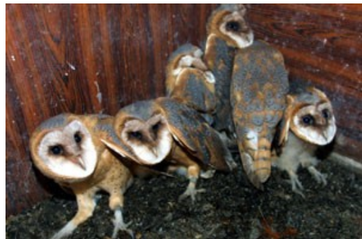
Junge Schleiereulen im Trafohaus in Belzig

Bereits seit vielen Jahren läuft das Trafohaus-Projekt zum Schutz der Schleiereule. Dabei werden ausgediente Trafohäuser von dem regionalen Energieversorger E.DIS übernommen und so vor dem Abriss bewahrt, da diese so genannten Turmstationen von Schleiereulen gern als Nistplatz genutzt werden, während durch Sanierungen von Scheunen und Dachstühlen andere Nistplätze verloren gehen. Der Naturparkverein hat inzwischen 10 Trafohäuser übernommen (in Kuhlowitz, Cammer, 2 x Belzig, Hohenlobbese, Deutsch Bork, Köpernitz, Lübnitz, Schlamau und Haseloff). Die E.DIS unterstützt dieses Projekt auch finanziell. Mehrere Schleiereulen-Generationen wurden in den Trafohäusern schon groß gezogen.